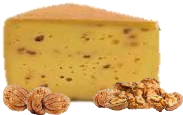
Mindestens 50 % Fett i. Tr. Schnittkäse aus Heumilch hergestellt

Als saisonales Kleinod präsentiert sich dieser Bio-Heumilchkäse, dem bereits vor der sorgsamem Reifung viele Stückchen erntefrischer Bio-Walnüsse beigemischt werden. Die Nüsse verleihen dem Käse außergewöhnliche Geschmackskomponenten - von mild-nussig über süßlich-herb bis fruchtig. Eine Käsespezialität für Kenner und Gourmets!